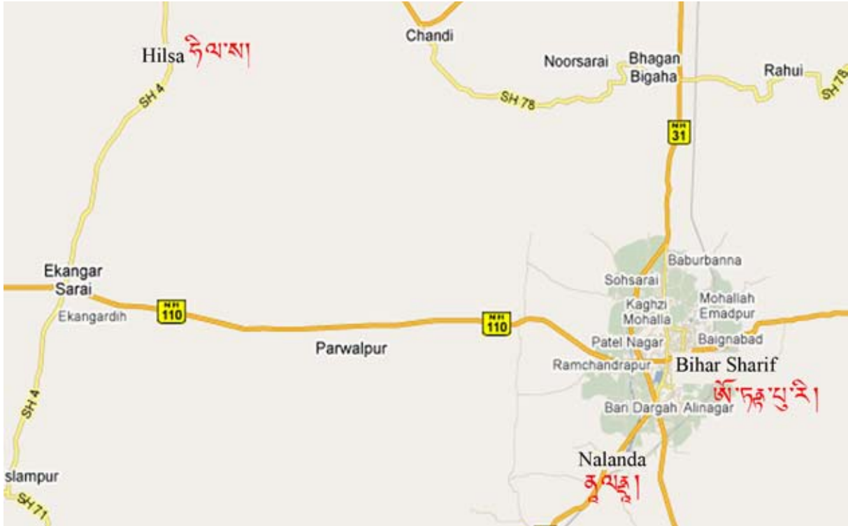
Tel Hara University

གཙུག་ལག་སློབ་གཉེར་ཁང་དེ་ཉེལ་ཏཱ་མངའ་སྡེ་གྲོང་གསེབ་ནང་ཡོད་སྟབས་ཉེལ་ཏཱ་མངའ་སྡེ་གཙུག་ལག་སློབ་གཉེར་ཁང་ཞེས་མིང་ ཐོགས་པ་ཡིན། ཉེལ་ཏཱ་མངའ་སྡེ་གྲོང་གསེབ་ནི་རྒྱ་ལྗང་ལེ་རུབ་བྱེད་ཉེལ་སྟོང་དལ་ཁོངས་ཀྱི་གྲོང་གསེབ་ཚུང་ཚུང་ཞིག་ཡིན། ངོ་སྟོན།