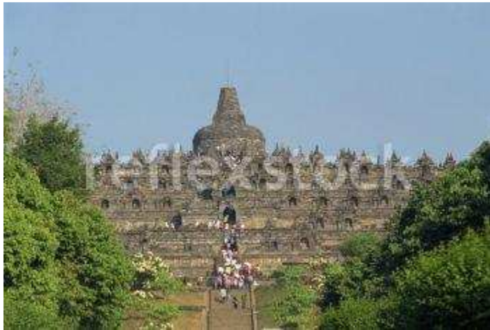
ག་རོ་ན་རྟུར་དང་ལྗོངས་རྒྱ་བ།