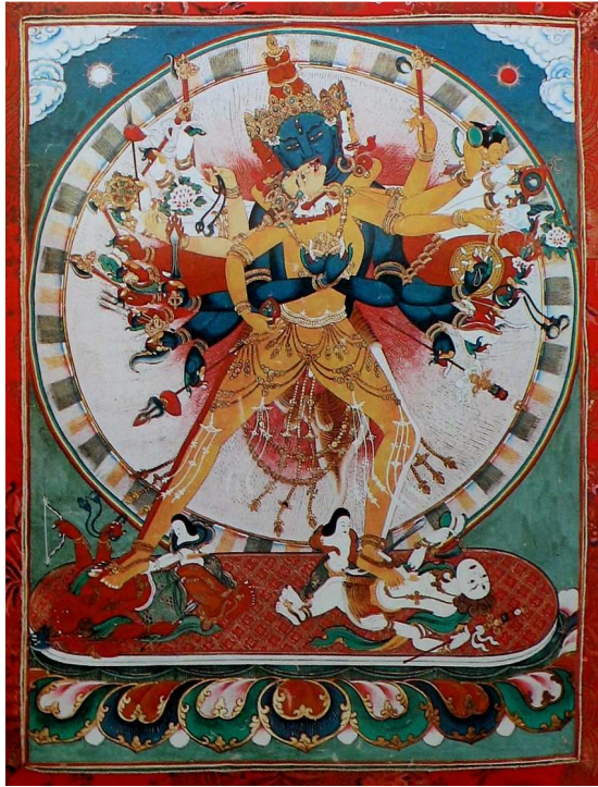
དཔལ་དུས་ཀྱི་འཁོར་ལོ་ལ་ན་མོ།