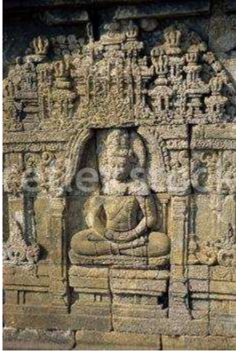
ག་རོ་ན་རྟུར་གྱི་བཞོན་འཛིན།