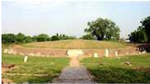
ཨ་མར་མ་ཉི་འམ་འབྲས་སྤངས་མཚོན་རྟེན་གྱི་ཕྱི་ཕྱོགས་མང་།

གཞན་དུས་འཁོར་ཅུ་རྒྱུད་གསུངས་སའི་གནས་སམ་འབྲས་སྤངས་མཚོན་རྟེན་དེ་ཡང་རྒྱ་གར་གློ་ཕྱོགས་དཔལ་གྱི་ རི་དང་ཐག་ཉེ་བའི་དེང་སྐབས་ཀྱི་ཨ་མར་མ་ཉི་ཞེས་པའི་གནས་དེ་ཡིན་པར་མཁས་པ་མང་ཤོས་བཞེད་པ་ མཐུན་ན་ཡང་། བོད་ཀྱི་མཁས་པ་བྱ་རྟོན་དང་ལྷོང་རྡོལ་སློ་མ་ངག་དབང་སློ་བཟང་སོགས་ལག་ཅིག་གིས་དེང་ སྐབས་ཀྱི་རྒྱ་གར་ཤར་ཕྱོགས་ཀྱི་ལ་ཆེའི་རྒྱལ་ཁབ་ཨིན་རྩ་ཉི་ཞི་ཡའི་རྒྱལ་ས་ཇ་ཀར་ཏའི་ Djakarta ལྷོ་རུབ་ ཕྱོགས་ཀྱི་ཞིང་ཆེན་ཇོག་ཇ་ཀར་ཏ་ Jogjakarta ཟེར་བའི་ས་གནས་སུ་ཡོད་པའི་ནང་བའི་མཚོན་རྟེན་