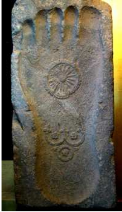
གནས་འདི་ནས་རྗེ་དཔེ་སངས་རྒྱལ་གྱི་ཞབས་རྗེས།