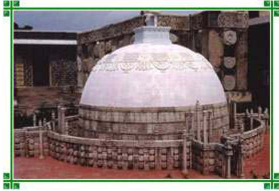
ཨ་མར་མ་ཉིའི་རྗེས་དྲན་མཚོན་རྟེན།